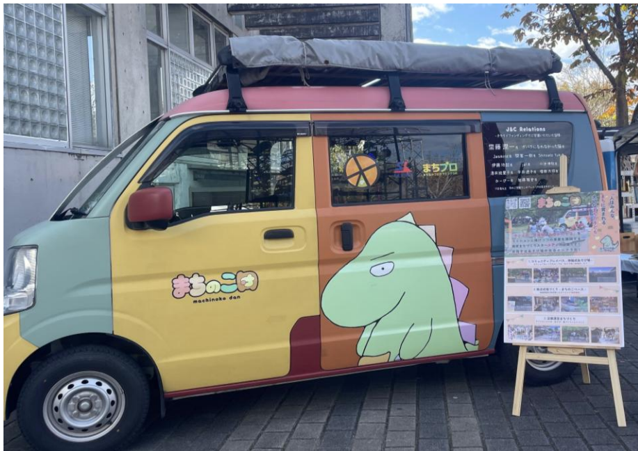
実際のコミュニティプレイバスとロゴ等の掲載イメージ