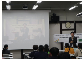
いばらき居場所づくり サミット2024

テーマは「子どもの居場所」。県内で子どもの居場所を開いて運営する方々の取り組みや、それをサポートする自治体が一堂に会し、疑問や課題を解決するヒントを模索しました。