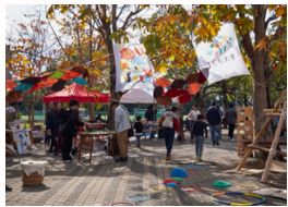
こども大学で 移動式あそび場

城西国際大学大学祭で実施したあそび場。地域の家族連れや在学生まで多くの人々が訪れ、こども大学のお店も活気づき、まるで商店街のような賑わいが広がる場となりました。