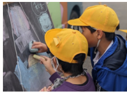
富士見ヶ丘小学校 秋まつり

秋まつりはPTA実行委員会や学校の先生方、保護者、地域の企業や団体が丸となり盛大に行われました。あそび場は楽しそうな子どもたちでいっぱい。笑顔と学びに溢れた1日でした。